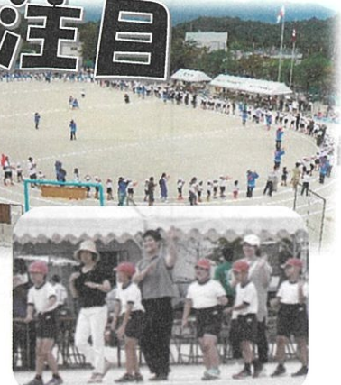
山田っ子大運動会 2019 2年生だった『6年1組』